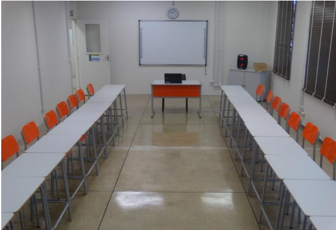
Sala de Aula 2