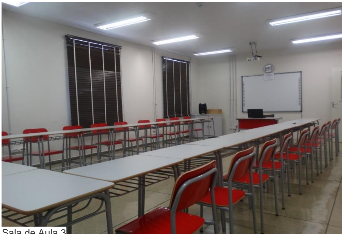
Sala de Aula 3