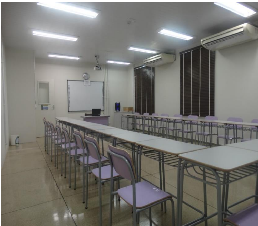
Sala de Aula 1